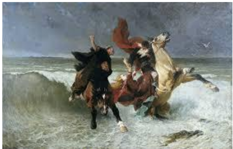
Evariste-Vital Luminais, La fuite du roi Gradlon , Musée des Beaux-Arts de Quimper